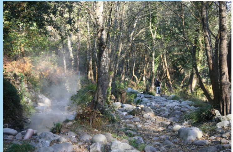
O río Cerves ten un percorrido moi encaixado no que abundan os rápidos e as fervezas. No seu curso baixo, antes de se xuntar co Miño, atópanse as burgas de Prexegueiro, unha zona onde hai numerosas surxencias de augas termais que abrollan a 41 °C, ricas en sulfuros e bicarbonato sódico.