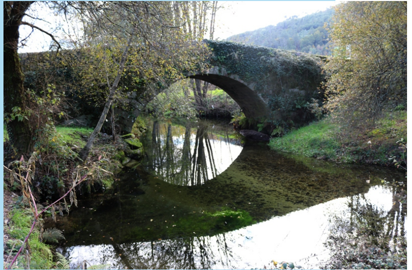
Ponte antiga no rego Outeiro (coñecida como a Ponte Romana), en Francelos.