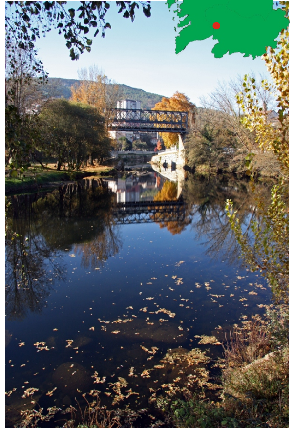
O Avia en Ribadavia, coa ponte do tren.