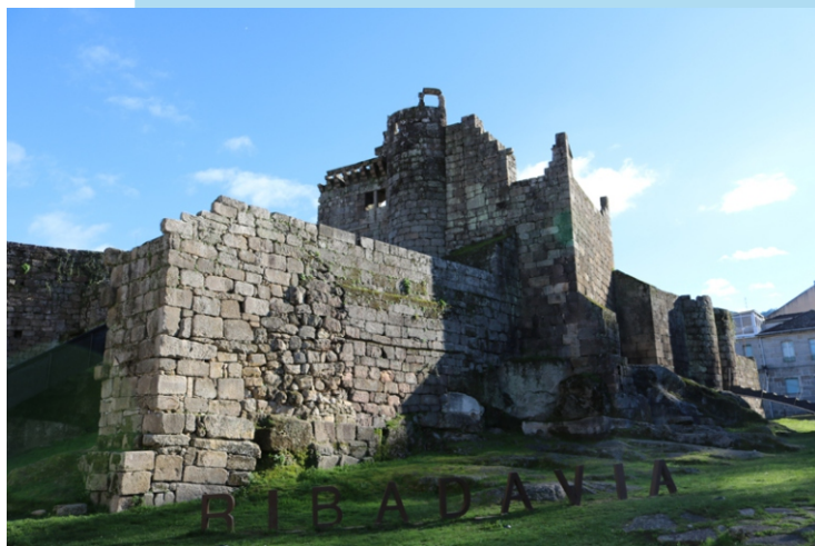
Castelo dos Sarmiento en Ribadavia. Foi construído no século XV. No recinto consérvase unha antiga necrópole do século IX e unha antiga capela con sartegos antropoides.