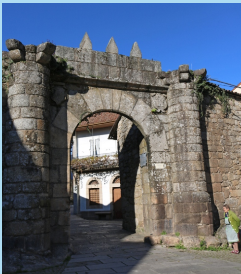
Porta da muralla.