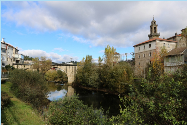
O Avia na ponte de San Francisco, en Ribadavia.