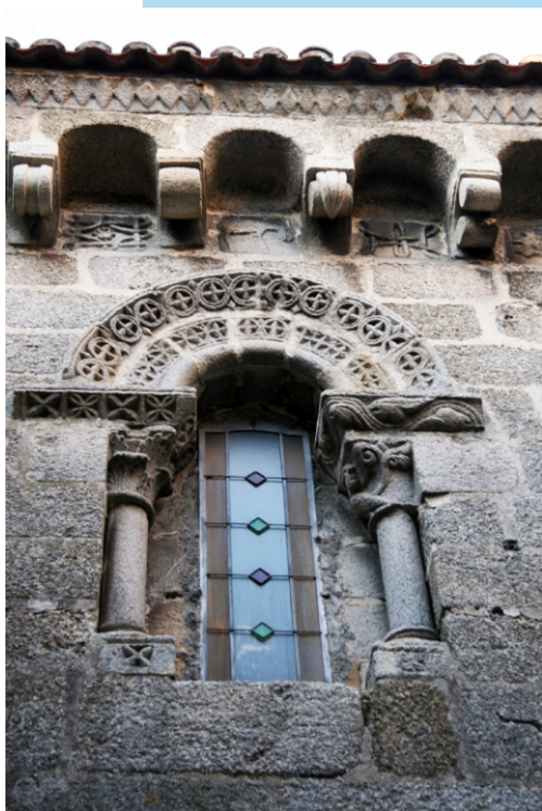
Detalle da igrexa románica de San Xoán.