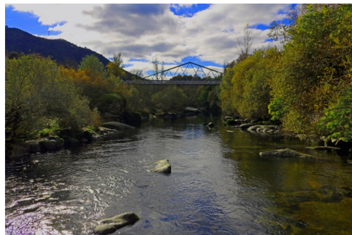
O Avia en Ribadavia, desde un punto da ruta.