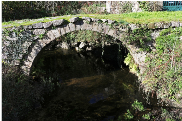
Ponte sobre o rego Maquiáns na Veronza.