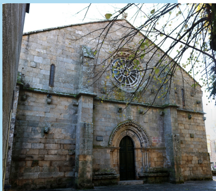
Igrexa de San Domingos.