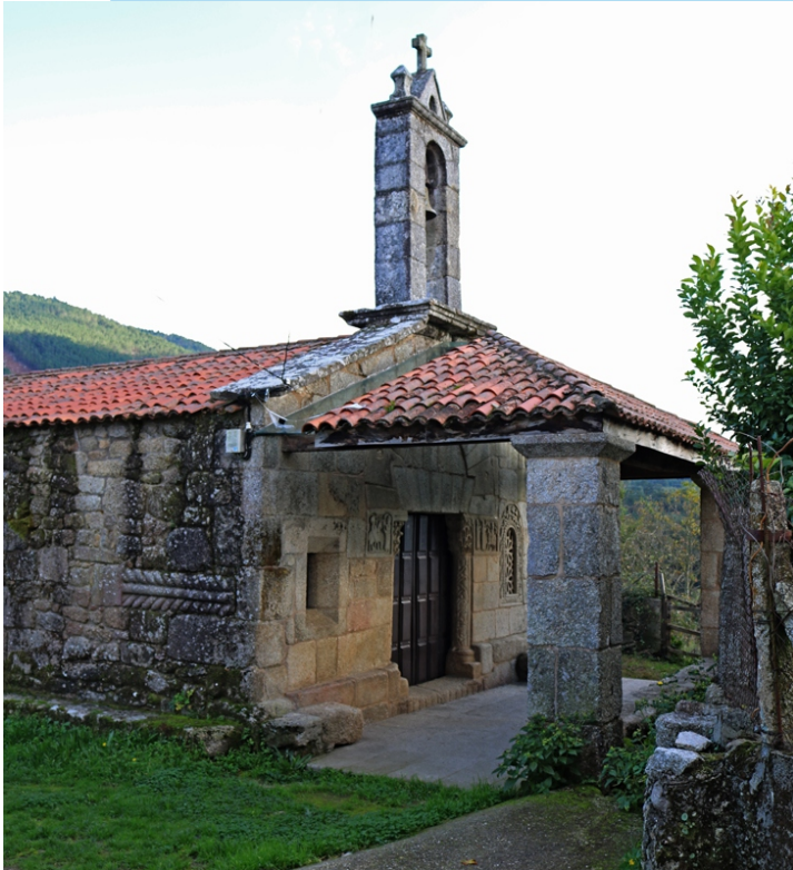
San Xés de Francelos, unha igrexa prerrománica do século IX.