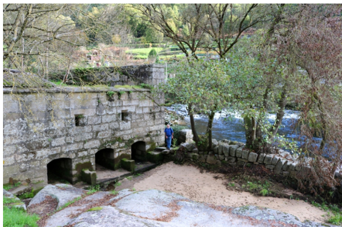
Muíño na beira do Avia, en Ribadavia.