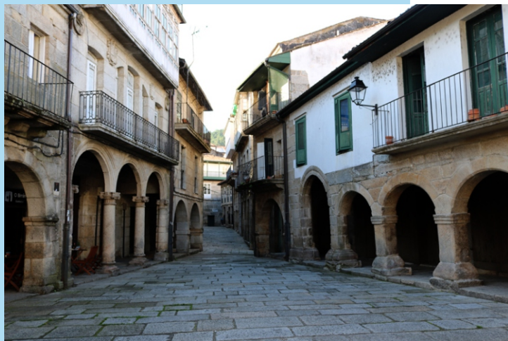
Praza da Madalena.