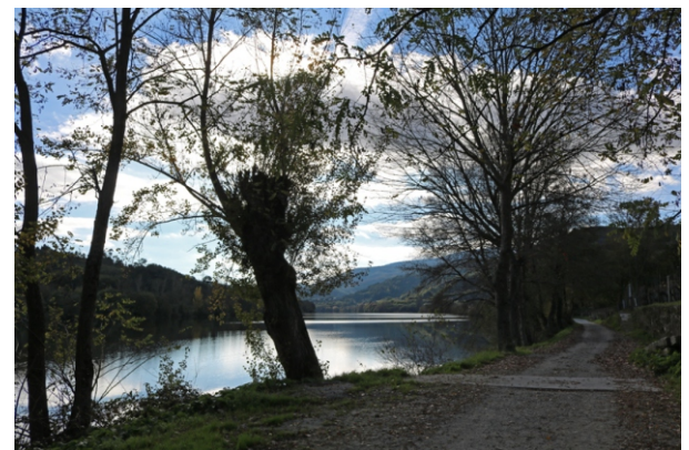
O Miño nun punto da ruta.

Unha ruta de interese natural (contorna dos ríos Miño, Avia e Cerves) e histórico artístico e etnográfico xa que en pouco espazo incluímos a visita a Ribadavia, á capela de San Xes, facemos unha camiñada polas beiras do Avia e do Miño e visitamos un fenómeno xeolóxico de interese, as surxencias termiais do río Cerves en Prexegueiro.