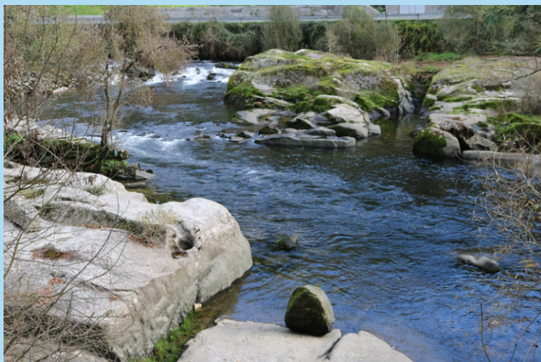
O Avia en Ribadavia.