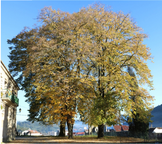
Tilleiras prateadas no campo de San Domingos de Ribadavia (incluídas no Catálogo de Árbores Senlleiras da Xunta da Galiza).