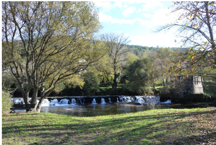
O Avia na área de lecer da Veronza.