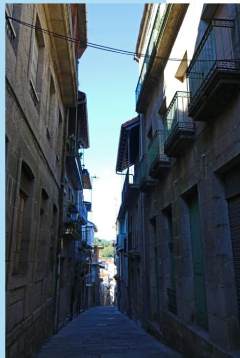
Unha rúa do casco antigo.