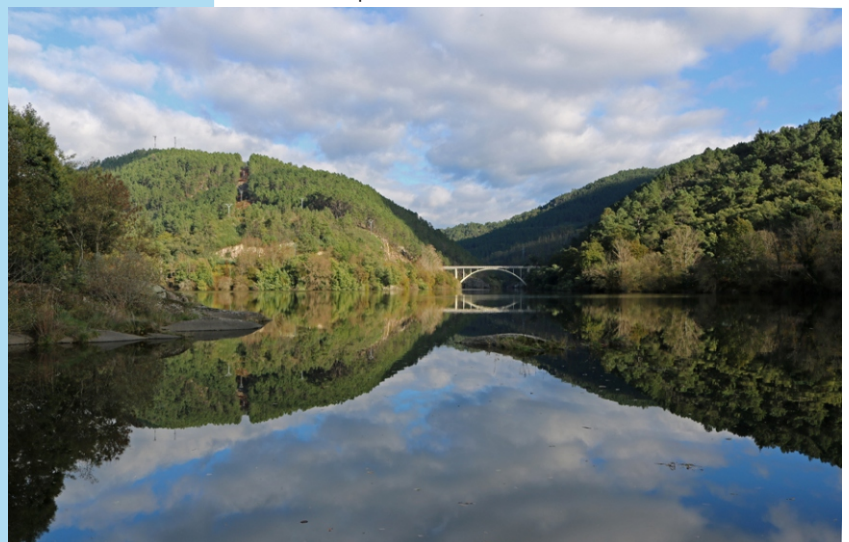
Confluencia do Avia co Miño no lugar da Barca.

Rivadavia está situada no centro da comarca do Ribeiro na confluencia do Miño e o Avia. É a capital do concello e da comarca, centro dos servizos administrativos e do Consello Regulador da Denominación de Orixe do Viño do Ribeiro. Conserva un importante centro histórico declarado Ben de Interese Cultural e Conxunto de Interese Histórico-Artístico (1978) que acolle importantes mostras artísticas (igrexas, castelos, pazos) e rúas medievais entre as que destaca a xudería. A finais do século XI, durante o mandato de García I, foi capital do Reino de Galiza, e máis tarde importante centro de comercio arredor das exportacións de viño do Ribeiro a Inglaterra.